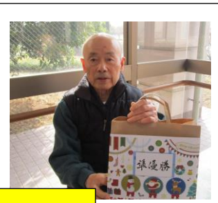
ご長寿早押しクイズ