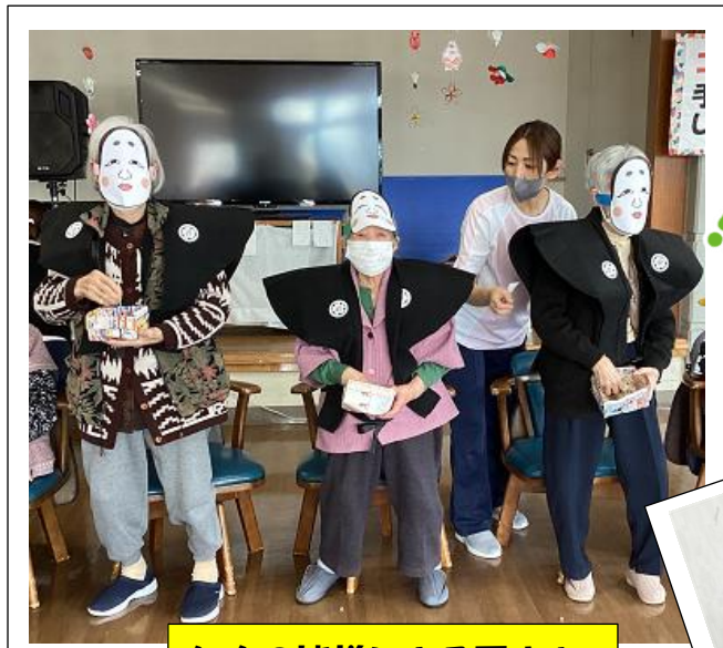
年女の皆様による豆まき