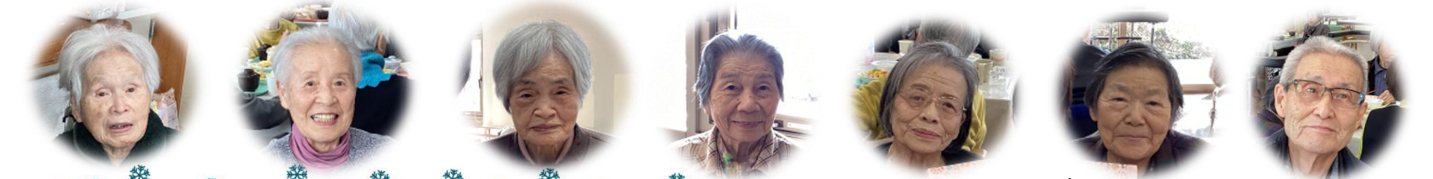
1月誕生者の皆様 お誕生日おめでとうございます!!